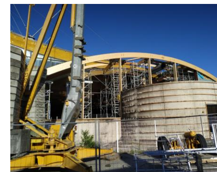
Intervention suite à un incendie