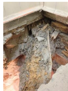
Plancher de sanitaires d'un lycée

En phase AOR, cette mission permet d'assurer la conformité des travaux réalisés avec les préconisations données dans le DCE et en phase EXE.