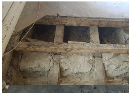
Plancher d'un théâtre

L'objectif de cette mission est de permettre la consultation des entreprises en capacité de réaliser les travaux proposés dans l'étude des solutions de réparation . Elle inclue la rédaction de documents écrits et la production de pièces graphiques.