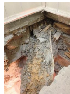
Plancher de sanitaires d'un lycée

En phase AOR, cette mission permet d'assurer la conformité des travaux réalisés avec les préconisations données dans le DCE et en phase EXE.