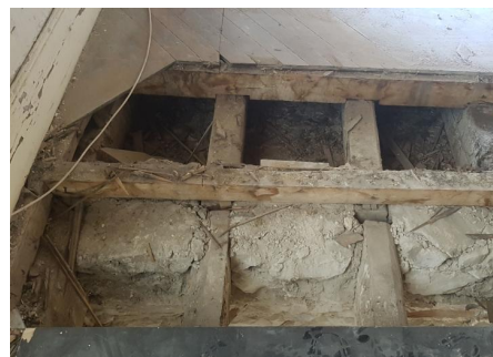
Plancher d'un théâtre

L'objectif de cette mission est de permettre la consultation des entreprises en capacité de réaliser les travaux proposés dans l'étude des solutions de réparation . Elle inclue la rédaction de documents écrits et la production de pièces graphiques.