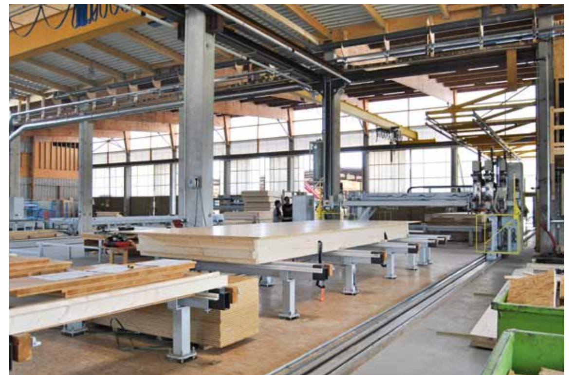
Approche industrielle Les équipements de SATOB, spécialiste de l'ossature bois, comprennent un portique à commande numérique sur lequel les panneaux de façade ont été fabriqués avec une précision au millimètre. L'épaisseur de l'isolant est de 36 centimètres en façades et en toiture.