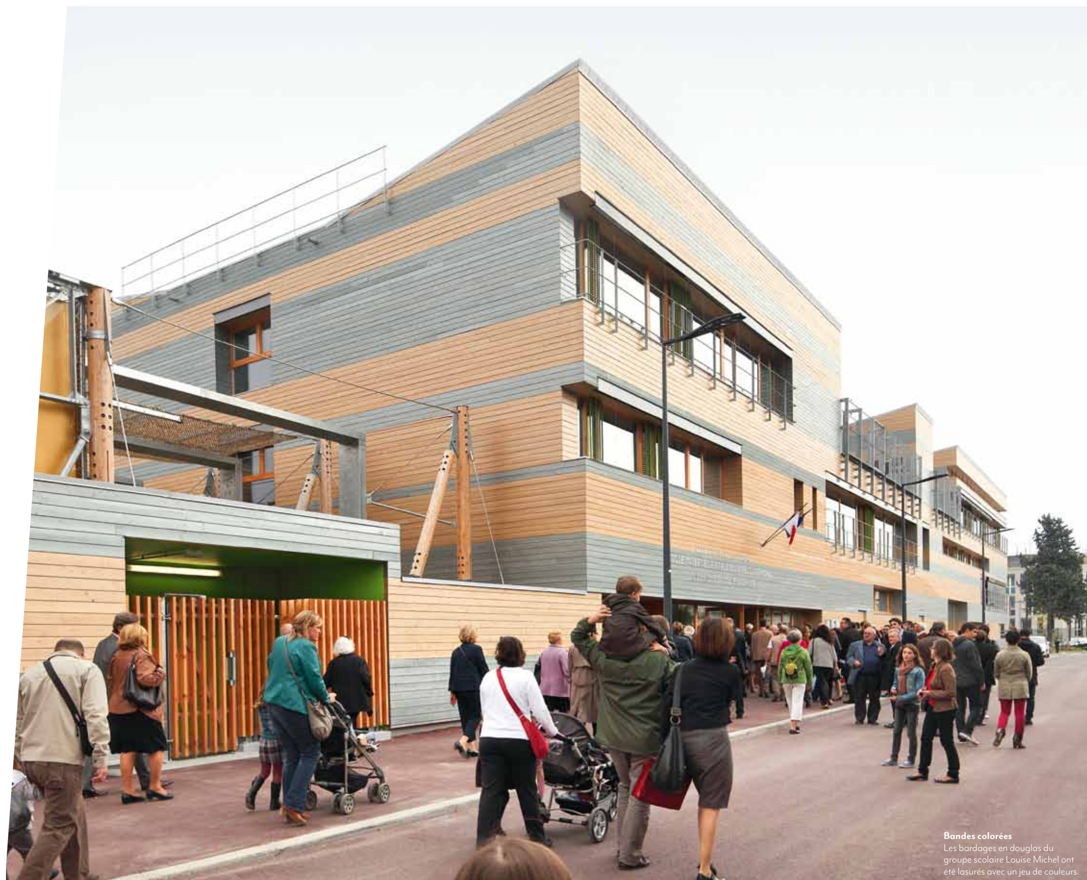
Bandes colorées Les bardages en douglas du groupe scolaire Louise Michel ont été lasurés avec un jeu de couleurs.

texte : hartmut hering plans et illustrations : adsc, gaujard technologies