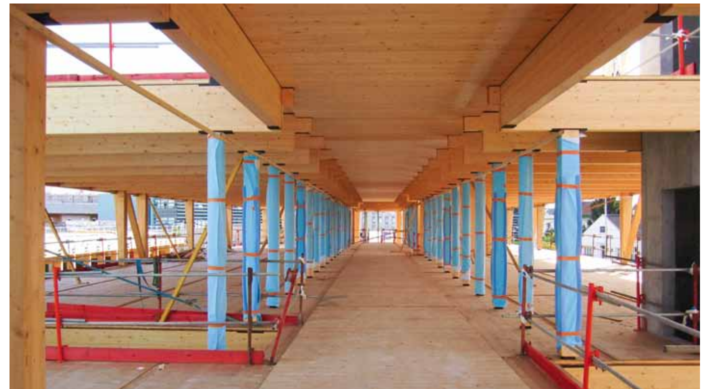
Confort phonique Afin d'améliorer la performance acoustique, les planchers sont lestés par le système Fermacell® (un résilient en fibres et une double épaisseur de plaques de fibroplâtre). Les plénums, également en Fermacell, font écran thermique.