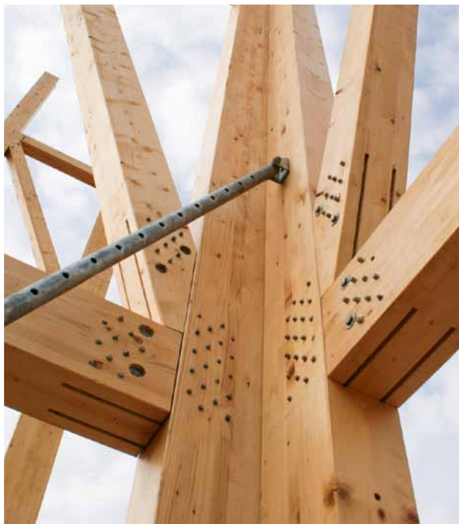
Filiales d'Arbonis l'entreprise Fargeot a fourni le bois lamellé-collé et l'entreprise Ducloux en a réalisé le montage, ainsi que celui des façades et toitures.

- Une école en paille à Issy : l'école Louise Michel, film de Michel Bulté pour Issy tv, sur YouTube. - Vidéo de l'essai au feu au cstb sur le site de Gaujard technologies (bet-gaujard.com), rubrique réalisations/éducation, groupe scolaire d'Issy-les-Moulineaux.